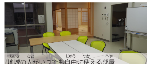
地域の人がいっでも自由に使える部屋