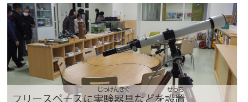
フリースペースに実験器具などを設置