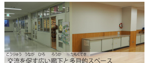
交流を促す広い廊下と多目的スペース