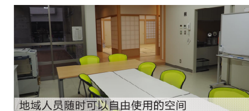
地域人员随时可以自由使用的空间