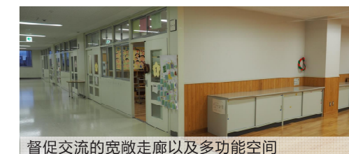
督促交流的宽敞走廊以及多功能空间