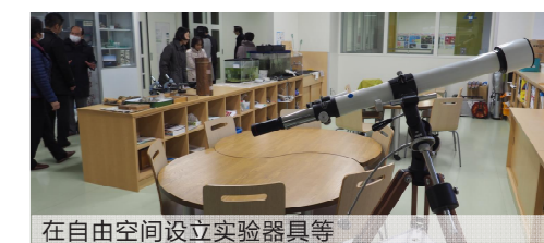
在自由空间设立实验器具等