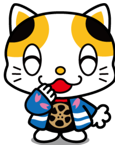
門真市イメージキャラクター 「ガラスケ」

社会人経験や専門知識を生かして 「住みたい・住み続けたいまち」を めざし、門真市で活躍する人材を求 めています。