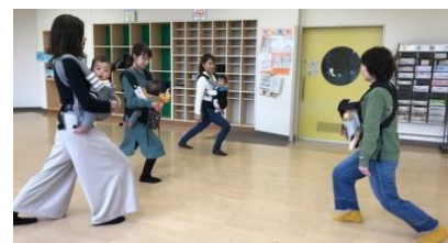
ステップは、これでいいのかな〜