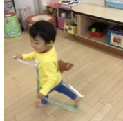
♪たーこーたこ あーがれ♪