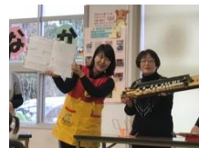
大正琴の説明です。