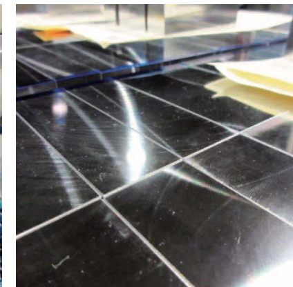
高い精度でカットされたプレート