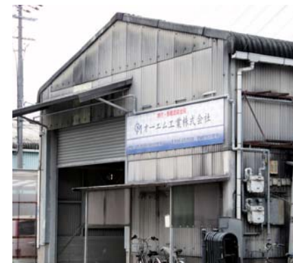
現在の本社工場外観