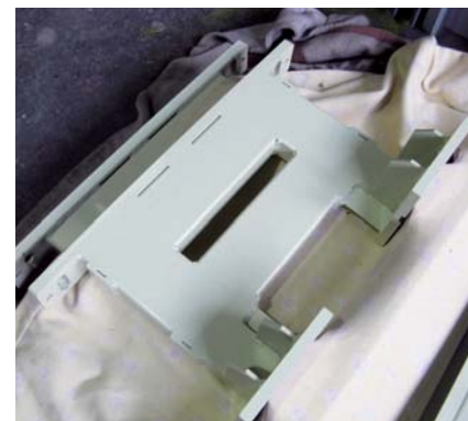
塗装を施した製品