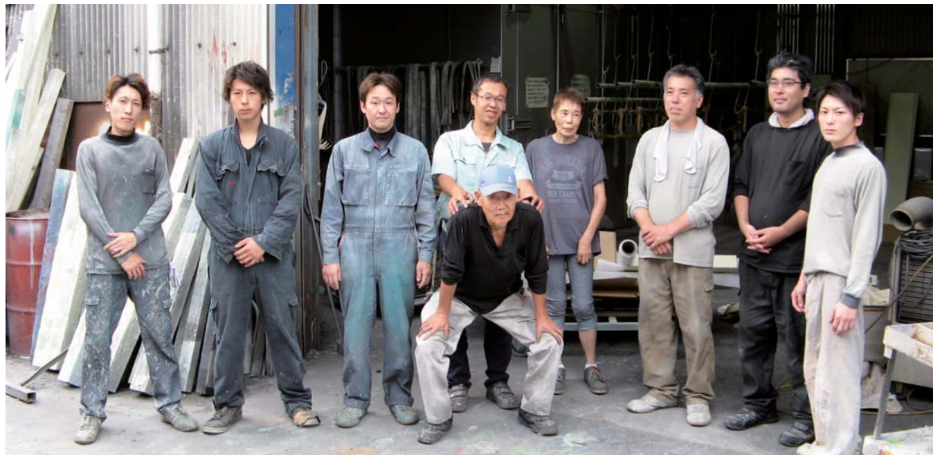
各年代がそろった従業員