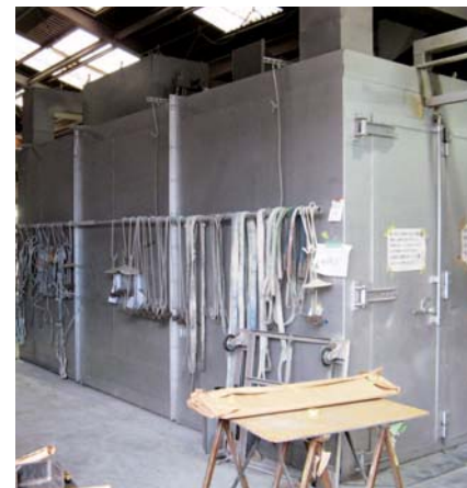
2室分割式の乾燥炉

塗装品質で高い評価を得た結果として、産業機械向けの塗装だけでなく、新規分野からの注文が入ることも増えている。ブランド衣料を販売する店舗の装飾物の塗装を継続的に受注している。店舗装飾向けなど意匠性の高さを求められる特殊な塗装にも積極的に挑戦することで、多様な塗装技術の習得につなげている。