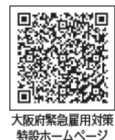
大阪府緊急雇用対策特設ホームページ

6万件以上の求人掲載 大阪府緊急雇用対策特設ホームページ 求職活動中の人に求人情報を提供しています。求職者登録をする、さまざまな就職支援サービスも利用できます。 問合先 府雇用促進支援金事務局 ☎06(4794)7057