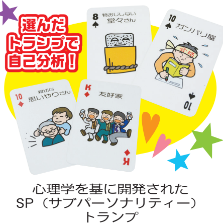
心理学を基に開発されたSP(サブパーソナリティ)トランプ