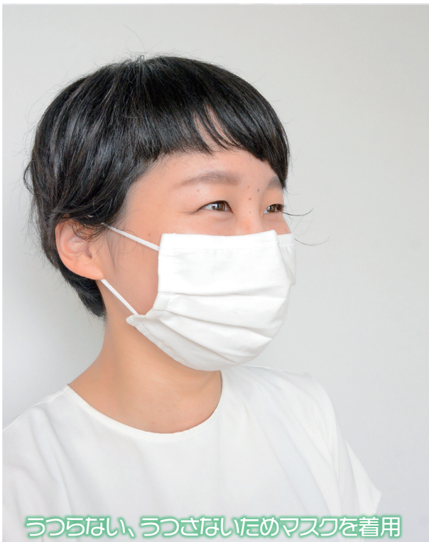
うつらない、うつさないためマスクを着用