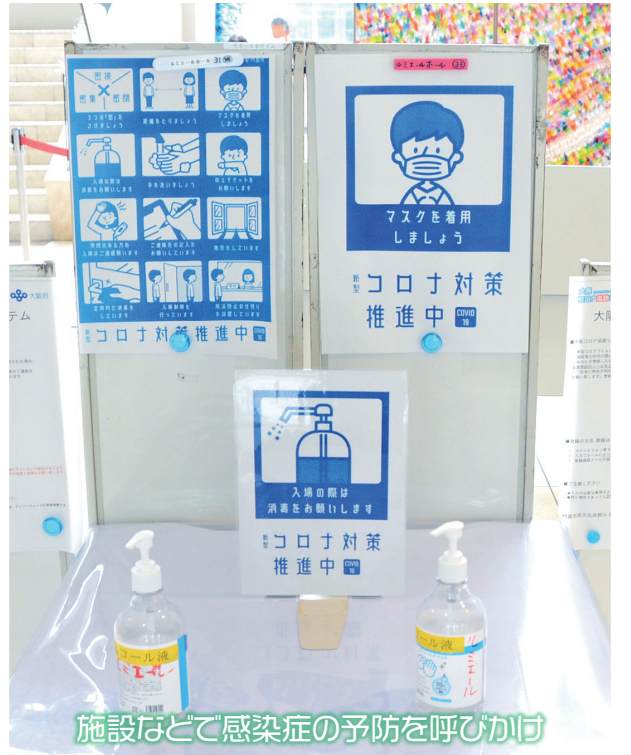
施設などで感染症の予防を呼びかけ