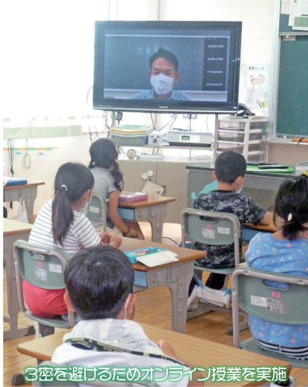
3密を避けるためオンライン授業を実施