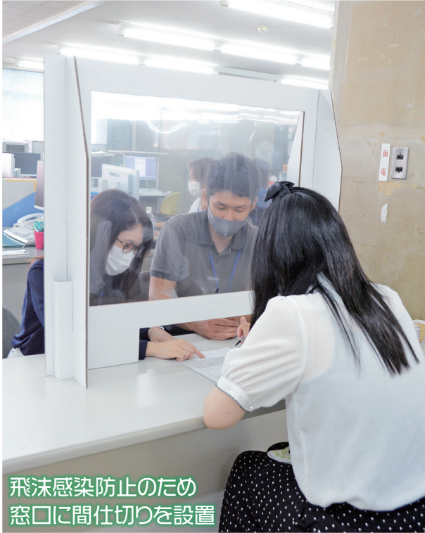
飛沫感染防止のため 窓口に間仕切りを設置