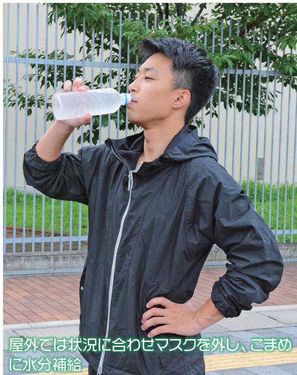
屋外では状況に合わせてマスクを外し、こまめに水分補給