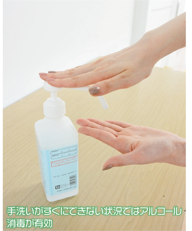
手洗いがすぐにはできない状況ではアルコール消毒が有効