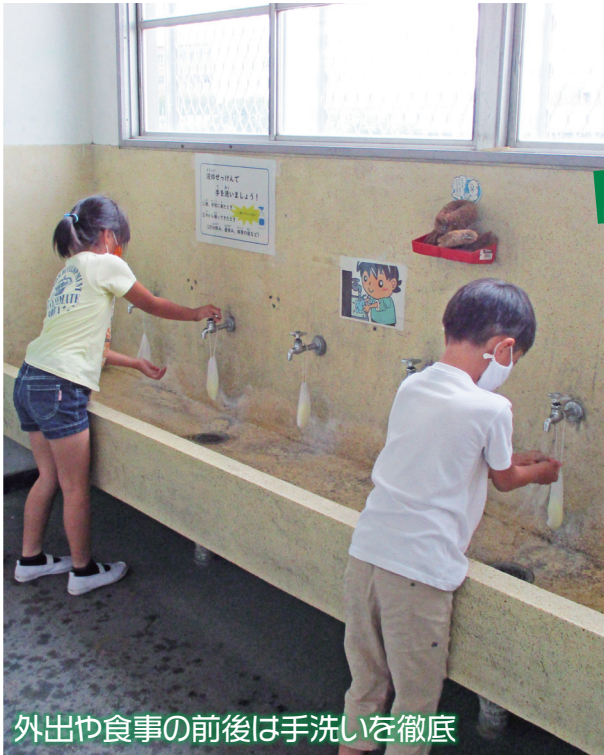
外出や食事の前後は手洗いを徹底