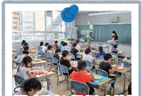
感染症防止に配慮した給食

給食の前後は必ず手を洗い、友達との会話を少し我慢して、みんな前を向いて食事をとっています。