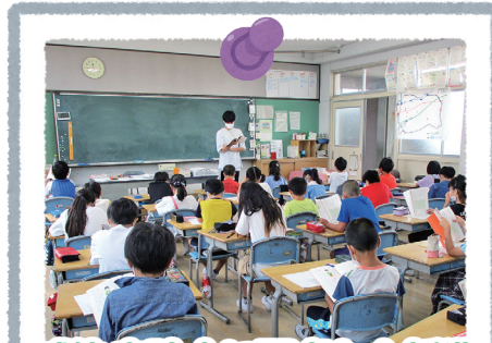
感染症防止に配慮した授業

学校では、6月15日から通常授業が再開しました。子どもたちが安心して教育を受けることができるように、新型コロナウイルス感染症の拡大防止対策を行っています。