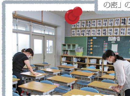
教職員の消毒作業

給食の前後は必ず手を洗い、友達との会話を少し我慢して、みんな前を向いて食事をとっています。