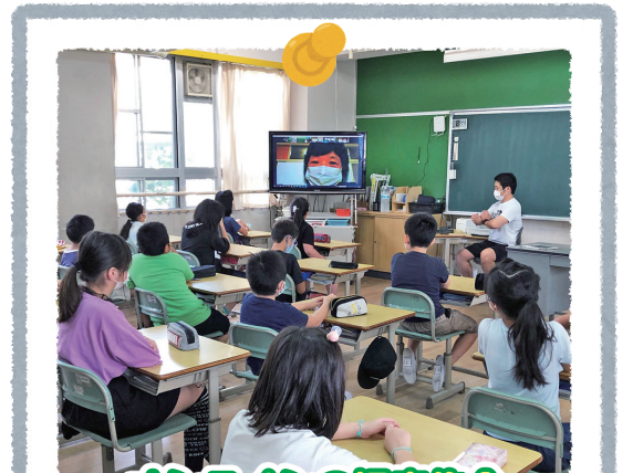
オンラインの児童集会

児童・生徒の席の間は可能な限り距離を確保し、換気を十分に行い「3つの密」の回避に努めています。