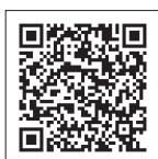
WEBアンケートはこちら

門真市第4期地域福祉計画策定に向けたWEBアンケート調査にご協力を 計画策定の基礎資料とするため、郵便によるアンケートとあわせて、WEBアンケートも実施します。左記のQRコードを読み取ることで回答ができますので、皆さんのご協力をお願いします。 回答期限 1月15日(金) 対象 市在住で16歳以上の人が ※昨年12月にアンケート用紙が届いた人はアンケート用紙で回答 問合せ先 福祉政策課 ☎06(6902)6093