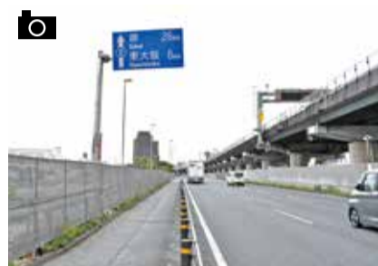
▲南を望む。 新駅建設予定地は看板奥の歩道上あたり。駅は三井ショッピングパークららぽーと門真・三井アウトレットパーク大阪門真と高架道路でつながる。