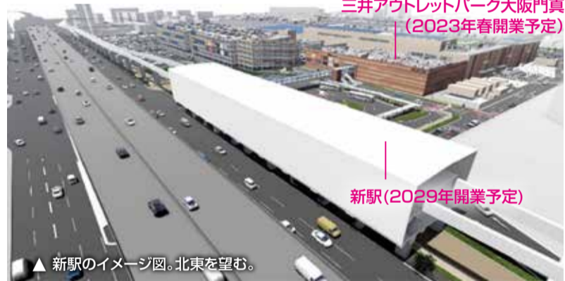
▲新駅のイメージ図。北東を望む。

三井ショッピングパークららぽーと門真・三井アウトレットパーク大阪門真(2023年春開業予定)