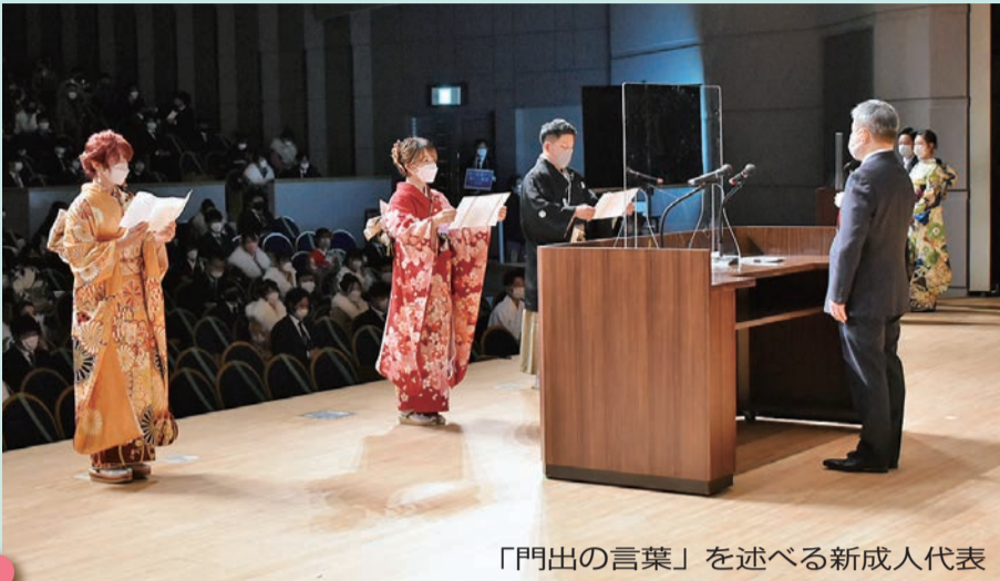
「門出の言葉」を述べる新成人代表