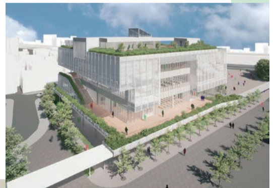
※画像はイメージのため変更する場合があります。

▶ 古川橋駅前での建設に向け動き始める（仮称）市立生涯学習複合施設 提供：遠藤克彦建築研究所