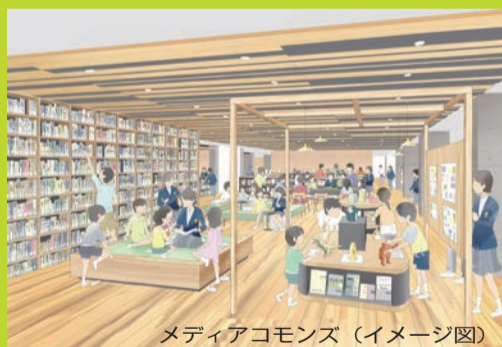
メディアコモンズ (イメージ図)

東門と西門をつなぐ場所にあって、大きな屋根を架けることで学校と地域がつながり、交流する拠点として活用できます。北側には地域協働ラボや体育館、児童クラブを配置し、南側には教室などの校舎を配置します。