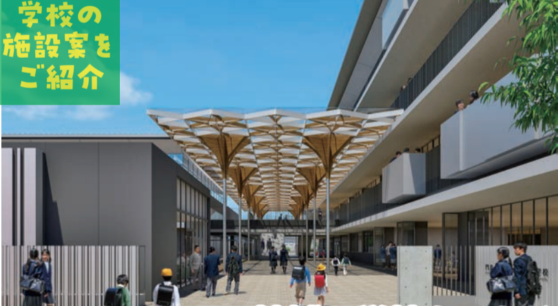
はすの葉モール (イメージ図)