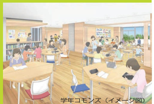
学年コモンズ (イメージ図)