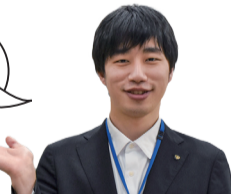
障がい福祉課職員