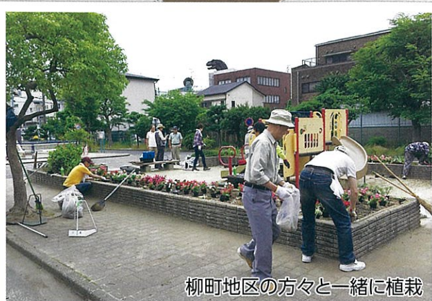
柳町地区の方々と一緒に植栽