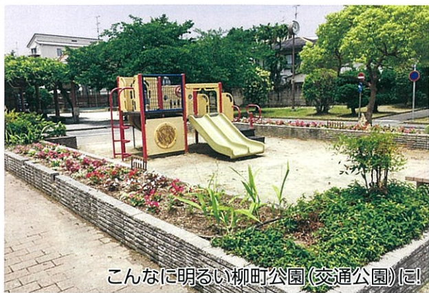
こんなに明るい柳町公園(交通公園)に!