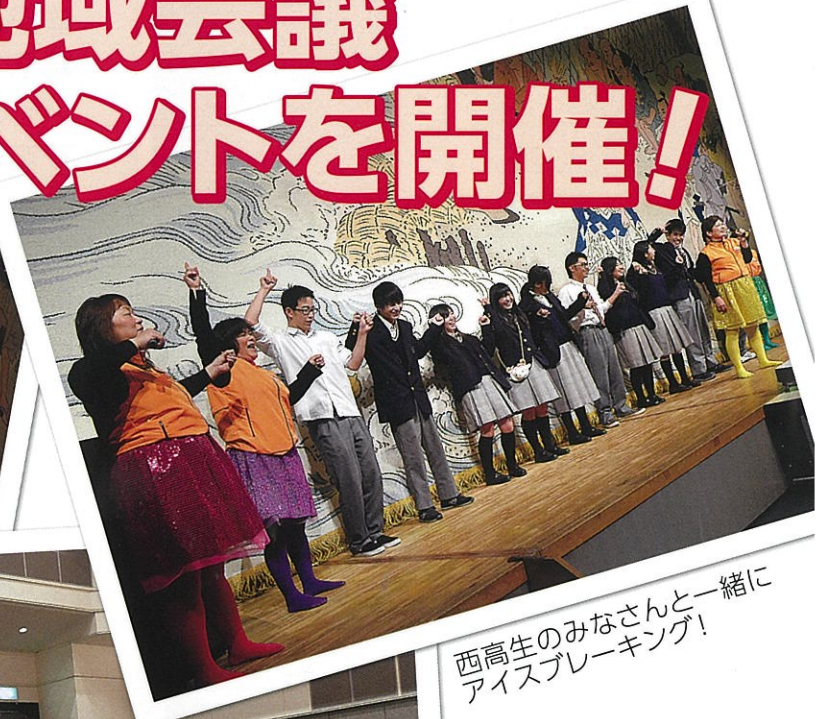
西高生のみなさんと一緒に アイスブレイキング!