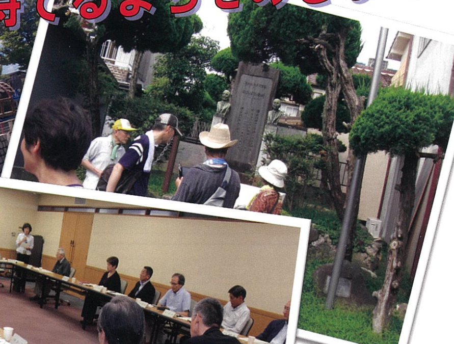
幣原兄弟の碑（一番町） ※ 弟喜重郎は門真出身の 第44代内閣総理大臣