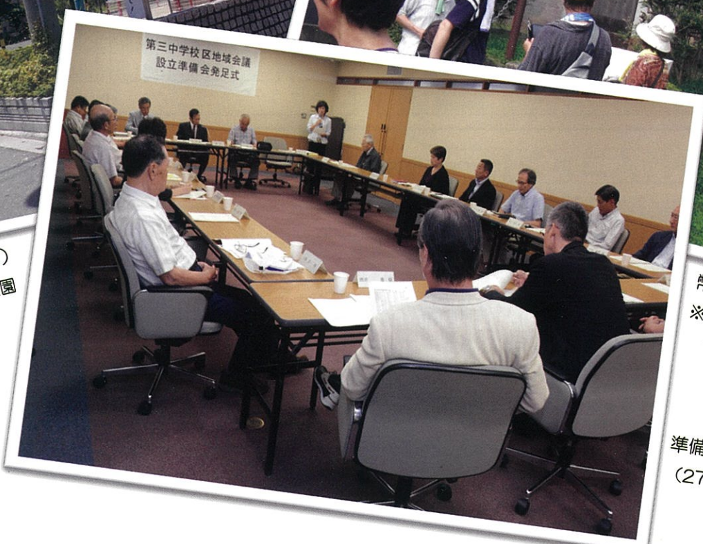
準備会発足式 （27年6月12日 市役所にて）