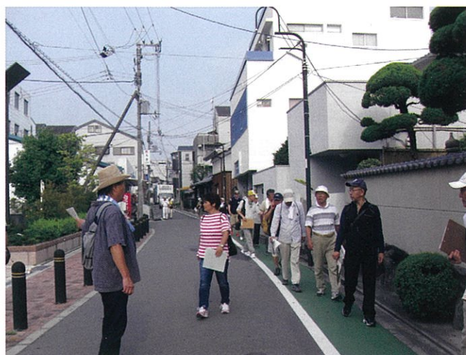
地域をあるき、まちの良い点や課題を再発見しました！

まちあるき中は、地域の情報交換を行うとともに、参加者同士の交流を図ることが出来ました。