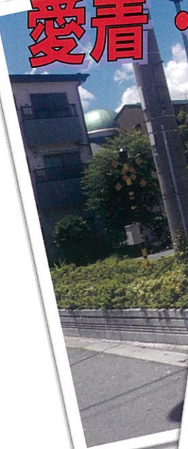
柳町公園（柳町） ※ 通称、交通公園