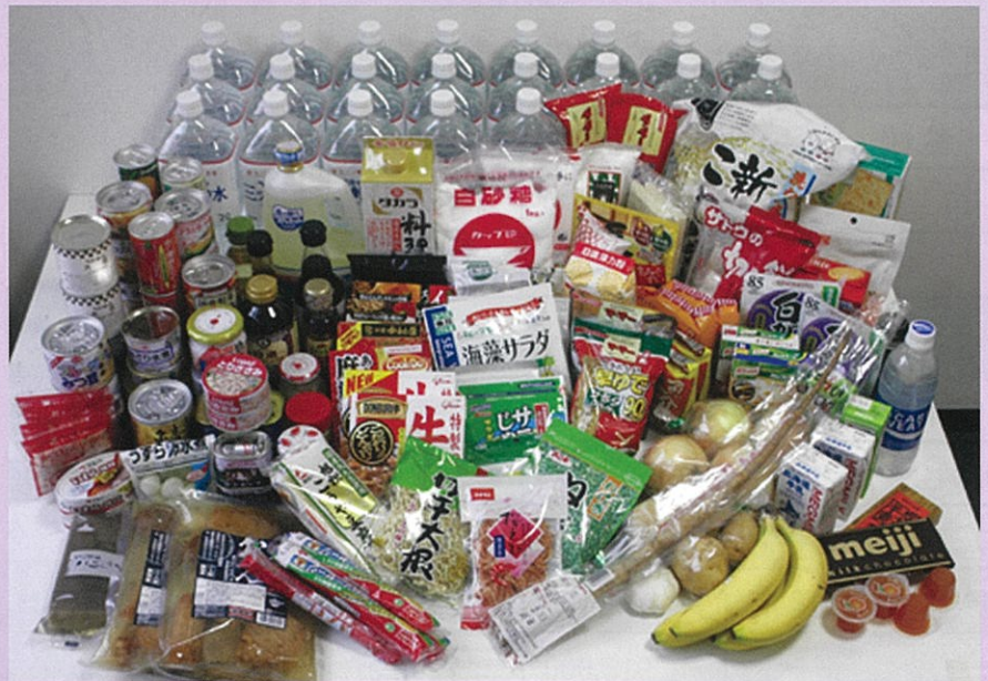
（一人1週間分の食料）

「普段食べているものをベース」に、備蓄した食品を日常の食事にも取り入れていくことも大切です。備蓄食品は、「病気などで買いものに行けない時」にも役立ちます。家族の構成や年齢などから適正な量や種類の食品を揃え、また備蓄しているものを把握して、常に新しいものをストックできるようにすると安心です。