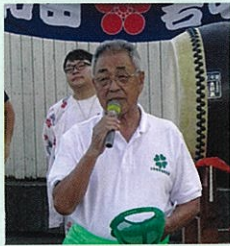
挨拶をする理事長

9月22日(土)に弁天池公園で音楽とエコキャンドルナイト～2018～が行われました。