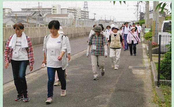
ウォーキングを楽しんで下さい

6月2日(日)に参加者108名が集まり、「ふれあいウォーキング」が行われました。