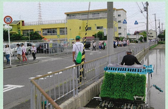
参加者の安全を見守る役員

「楽しいイベントを企画いただき有難うございました。楽しく過ごすことが出来ました」と話していました。