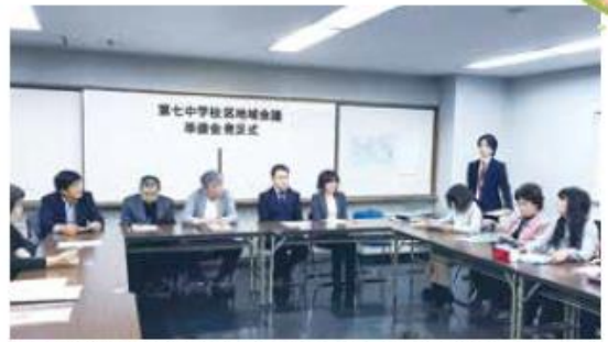
地域会議準備会発足式(31/01/18 門真市立文化会館にて)

現在、第七中学校区ではフエスティバル等のイベントを通じ、地域のつながりを創っておりますが、更に地域コミュニティの絆を深め、まちの課題解決や魅力づくりに、住民の皆様とともに取組めるよう、「地域会議」の設立に着手しようと考えております。 今後、地域会議準備会委員で検討を重ね、新たな元号が開始されるのと同時に、第七中学校区においても「地域会議」を設立し、住民主体のまちづくりを進めていくべく考えております。ぜひとも、皆様のご協力とご結集をお願いいたします。 (第七中学校区地域会議準備会委員 一同)