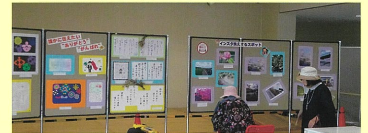
地域会議 News 令和2年11月臨時号