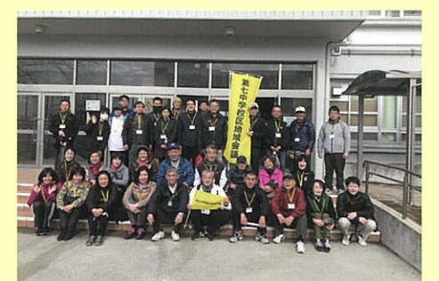
地域会議 News 第3号