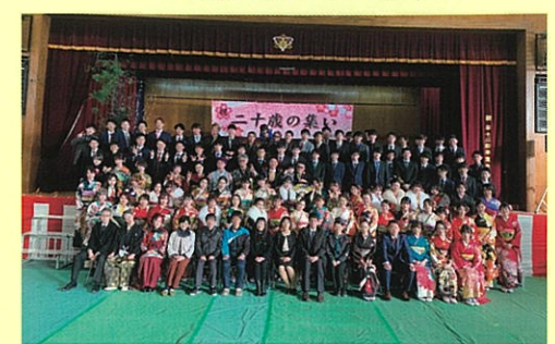
地域会議 News 第2号