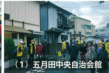
(1) 五月田中央自治会館