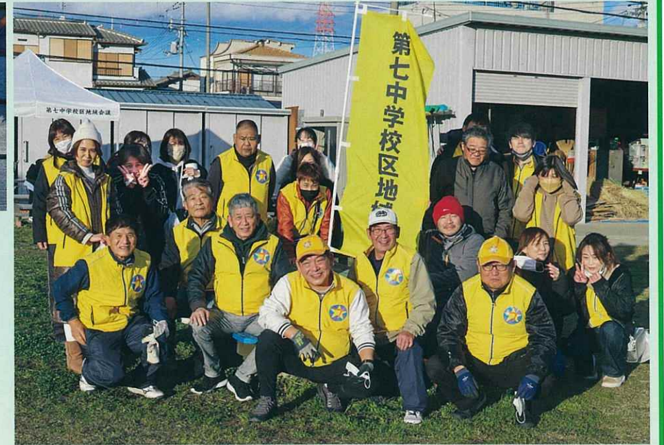
前日の雨から一転、お天気も良く大成功でした