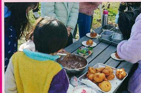
何度も追加で作ります