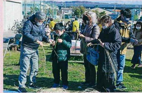
お正月飾りのしめ縄作り指導