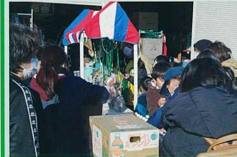
千本引きコーナー