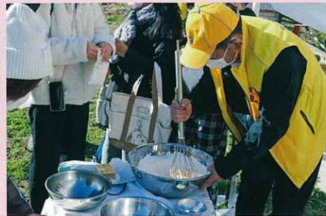
ホットケーキミックス+卵