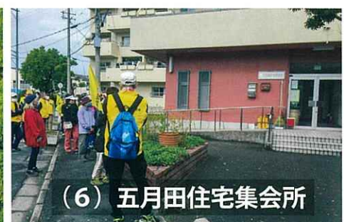
(6) 五月田住宅集会所