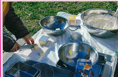
溶かしバターを加え