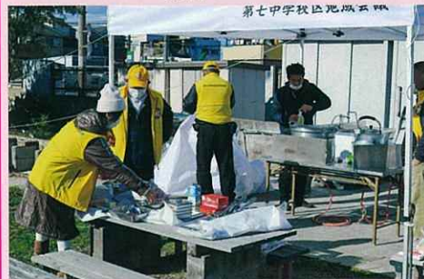
ドーナツ作り準備 (防災テントが活躍)