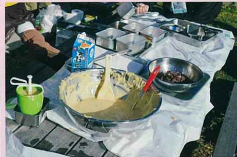
牛乳を加えてよく混ぜる