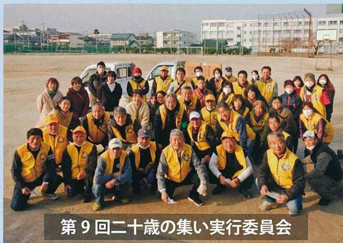
第9回二十歳の集い実行委員会