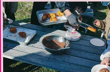
湯煎したチョコレートを塗って