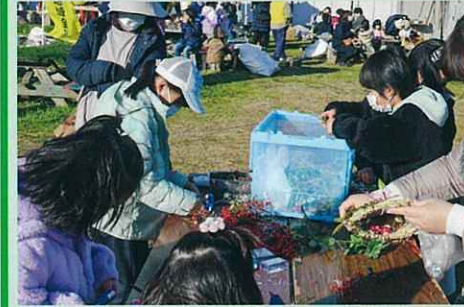
今年は、しめ縄・正月飾りが人気でした