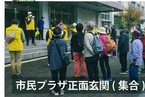
市民プラザ正面玄関(集合)