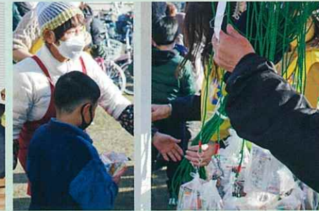
お菓子の詰め合わせセット