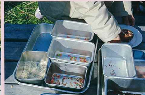
あっという間に売り切れ