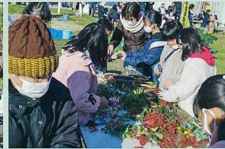
針金・ペンチ・グルーガン・木工ボンド