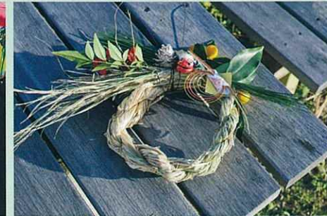
しめ縄・正月飾り