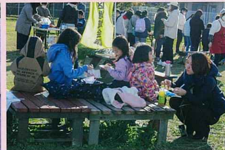
みんなに行き渡ったかな?