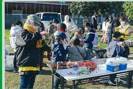
しめ縄・クリスマス飾りの材料