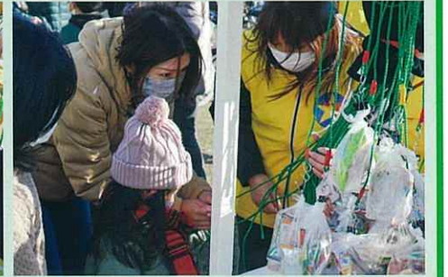
良い思い出になります