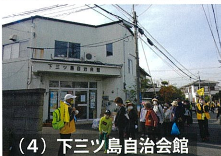
(4) 下三ツ島自治会館