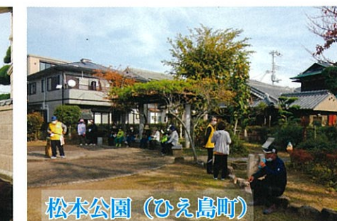
松本公園(ひえ島町)