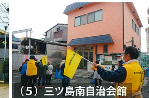
(5) 三ツ島南自治会館