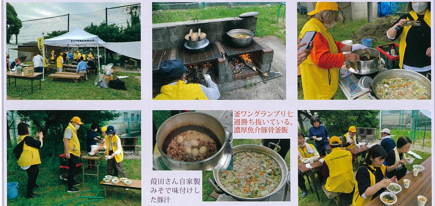
金ワングランプリ七週勝ち抜いている、濃厚魚介豚骨釜飯

その後、二島小学校校庭の"かまど"を使って、豚汁と釜飯の炊き出し訓練を行いました。防災テントの組み立て訓練や、テーブルと椅子の設置から、調理(濃厚魚介豚骨釜飯、特製みそで味付けした豚汁)まで、参加者で協力して行いました。訓練で体力を使ったあとの釜飯、豚汁は格別の味でした。