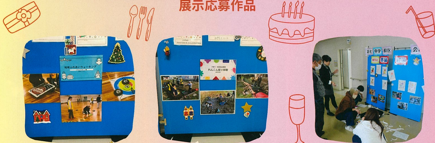
地域ふれあいウォーキング