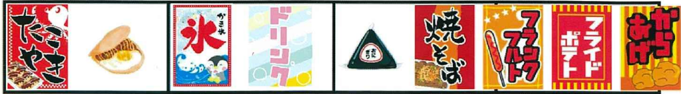
たこ焼き 玉せん かき氷 飲み物 おにぎり 焼きそば フランクフルト ポテト から揚げ