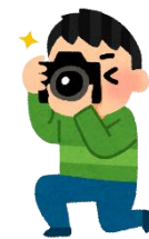
イベントでの写真撮影