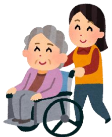
福祉施設での高齢者向けレクリエーションの開催