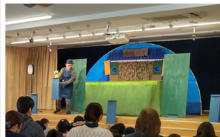
柳町園での人形劇