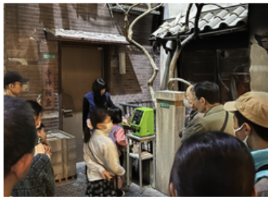
子どもによる公衆電話での 正しい119番通報の練習