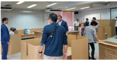
ダンボールベッド組立体験