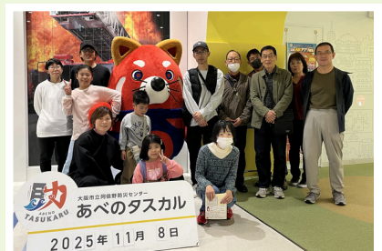
南海トラフ地震に備えましょう