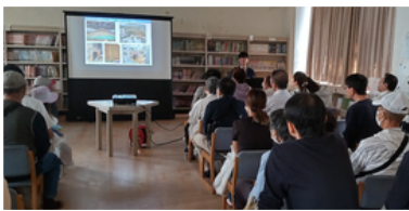
危機管理課による防災講話