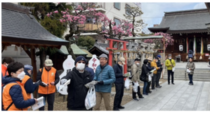
茨田堤の鎮守として創建された堤根神社