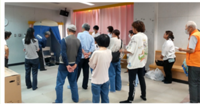
簡易トイレ使用説明