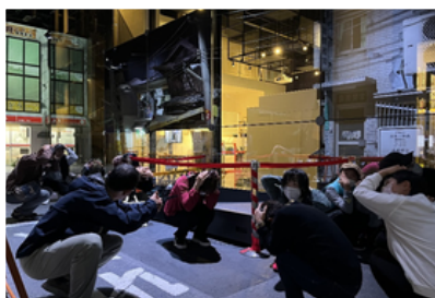
がれきの街での余震体験 頭を守れ!