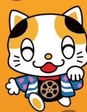
門真市イメージキャラクター 「ガラスケ」