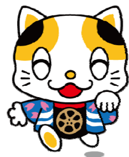
門真市イメージキャラクター 「ガラスケ」