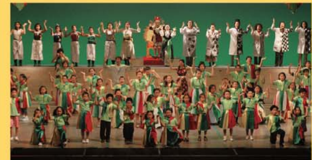
門真市民ミュージカルの様子