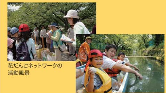
花だんごネットワークの活動風景