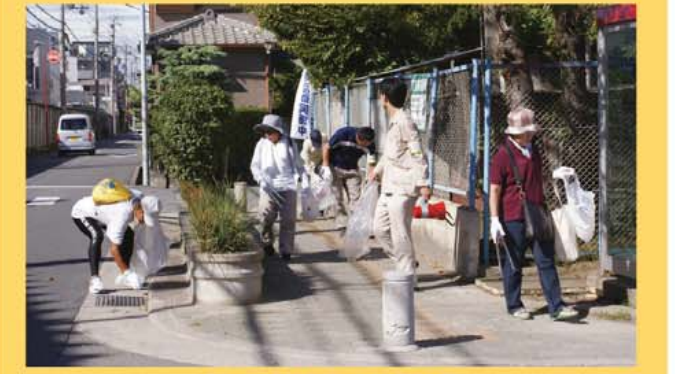
「キラッと!かどま」活動風景