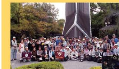
「歩こうよ・歩こうね」運動の風景