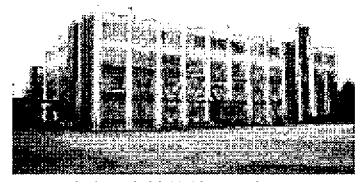
浜町中央小学校等整備工事 4億475万円