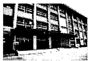
市民プラザ整備工事 3億4599万円