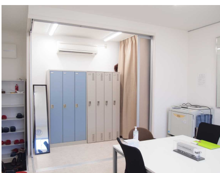
株式会社エヌ・ワイ・ティ