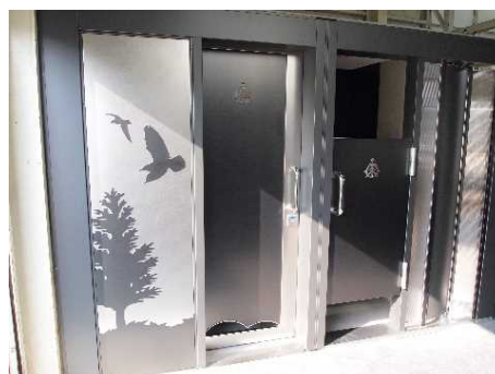
株式会社一瀬製作所