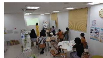
パーソナルカラー入門