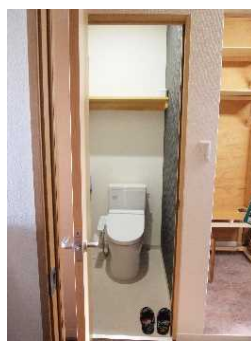
株式会社福本水道工業