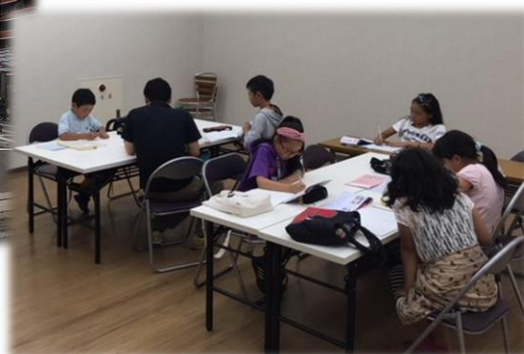
9人の子どもたちが → 参加してくれました