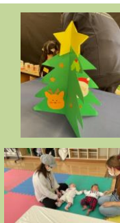
ほら見て！ツリーができたよ