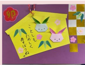
「うさぎの折り紙」拡大して見てね