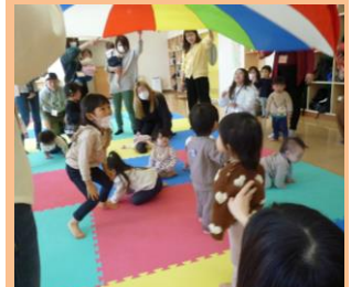
3/27 麦の子共同保育園