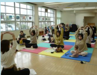
3/6 ベビーマッサージ&ヨガ