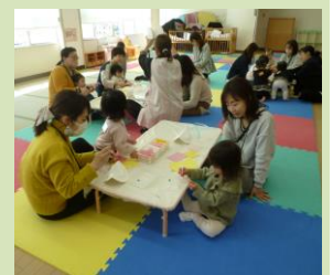
3/11 大阪ひがし幼稚園