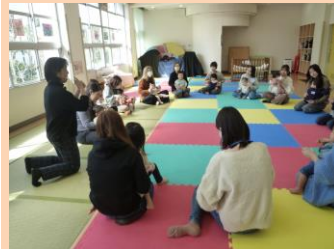
3/7 親子で English