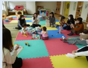
3/19 お話サロン (フリートーク)