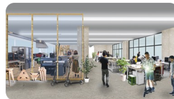
高い技術力・開発力を生かした課題解決型ビジネスの産業育成