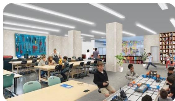
多層な人々と多様性のあるものづくり・探究型教育の場