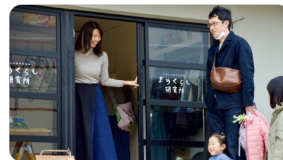
働きながら住みたくなる魅力的な暮らしの提案