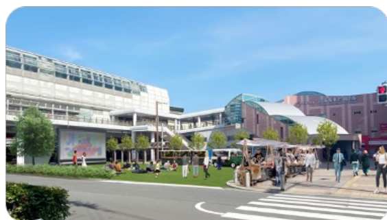
まちのイメージを向上させ、コミュニティ形成の場となる公共空間