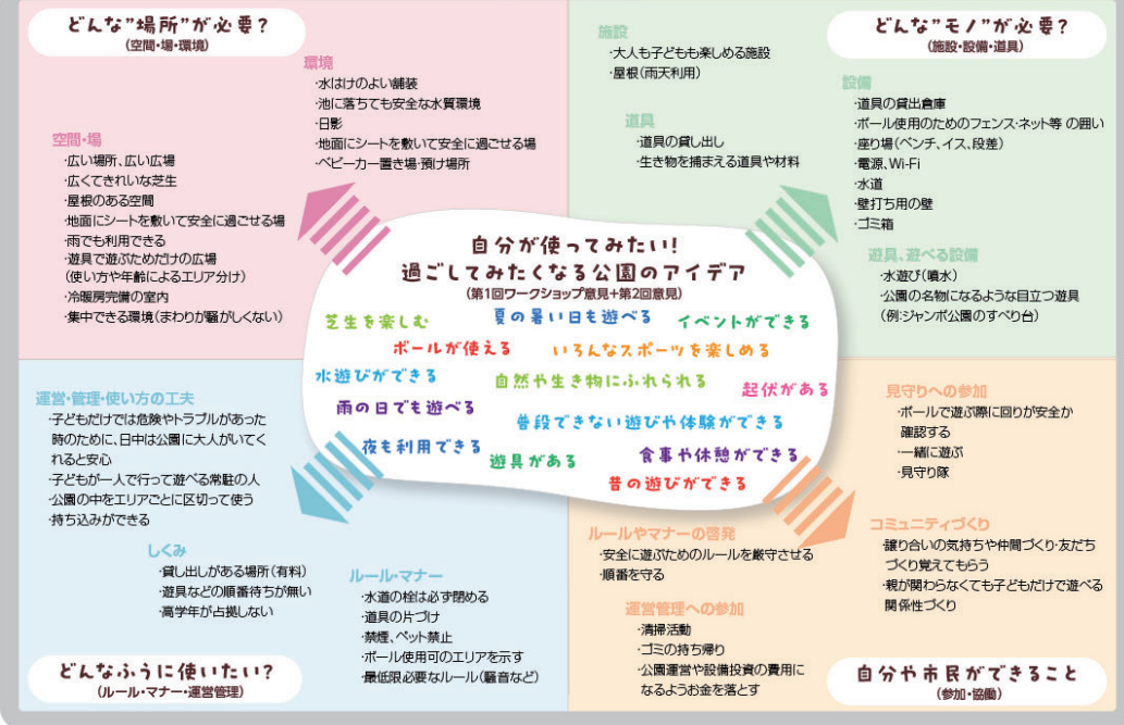
(第2回ワークショップ意見)

第1回ワークショップで出たアイデアを実現するために「必要なこと」を4つの視点で考えました！