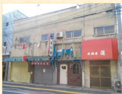
【従前の老朽木造建築物】