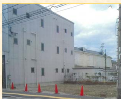
【工事完了後の更地】