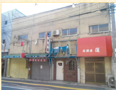
【従前の老朽木造建築物】