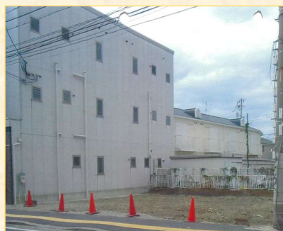
【工事完了後の更地】