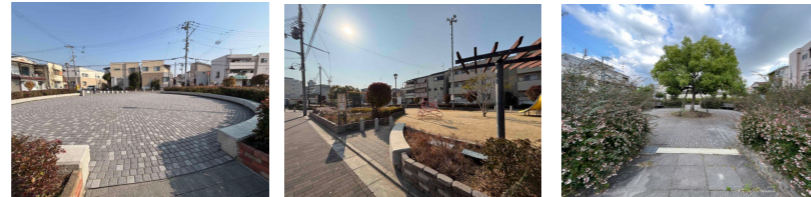
石原町東2号広場 石原町東公園 石原町東広場