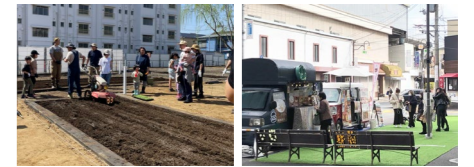
コミュニティファーム (埼玉県草加市) 店舗空間イメージ (羽衣駅前社会実験)