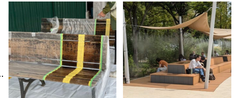
共通色でベンチを塗装した際のイメージ ミスト機能を持つパーゴラとベンチ