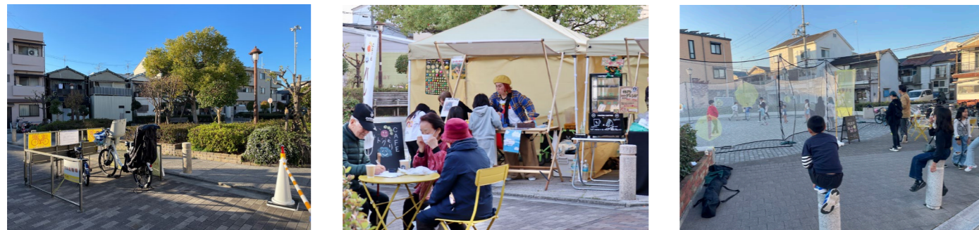
道路上へのベンチ付き自転車スタンドの設置 マルシェスタンド及び滞留テントの設置 子どもの遊び場(ボール遊び等)の設置

石原町東2号広場、石原町東公園、石原町東広場のウォークラブルな環境づくりの検証を目的に実施した。