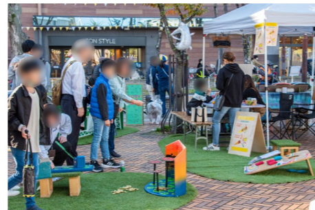
親子で安心して楽しめる場