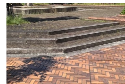
良質な舗装(レンガ、タイル)