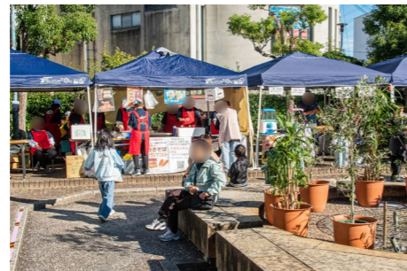
安全に休憩ができる設え