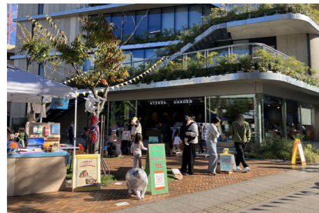
周辺施設との一体利用