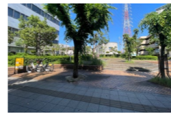
植物に囲われた公園空間