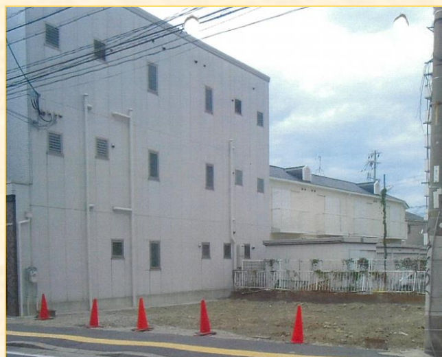
【工事完了後の更地】