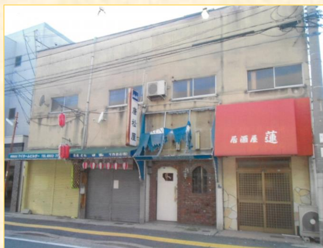
【従前の老朽木造建築物】