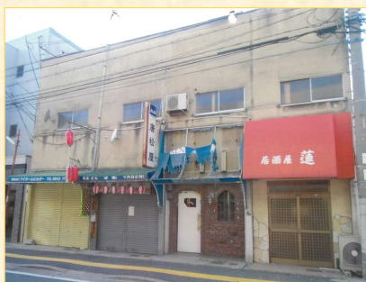
【従前の老朽木造建築物】