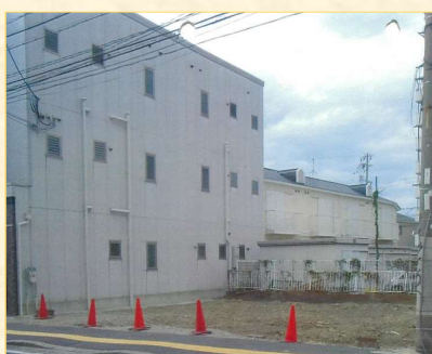
【工事完了後の更地】