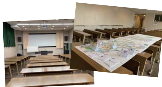
6つの地域の公園ボードも大集合!

6つの地域それぞれで考えてきた、これからのかどまの公園のことについて参観者の皆さんに発表していただきます。「他の地域はそんなことを考えたのか」「このアイデアは自分の地域でもできそう」など、考えてきたことを共有するとともに、実現するためにはどうすればよいかなどについて、意見交換を行う予定です。