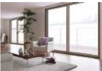
窓断熱リフォーム