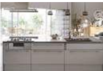
キッチンリフォーム