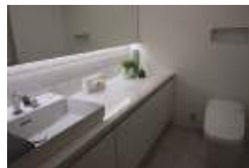
トイレリフォーム